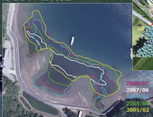
藻場分布の経年変化